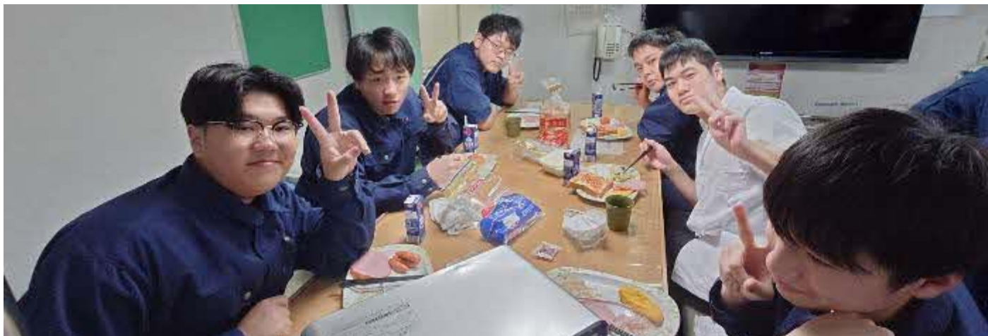
朝から実習生は元気いっぱい！！食事も予想を超える消費量です！！

学習もしっかりと着実に進めています！エンジニアコースは本日神海丸の燃料配管システムの勉強をしました。実際に神海丸の配管図を確認して、事前に相談をして、各系統確認を実施しました。この後実習生たちは各当直の時間に実際に現場にて配管調査を実施します。