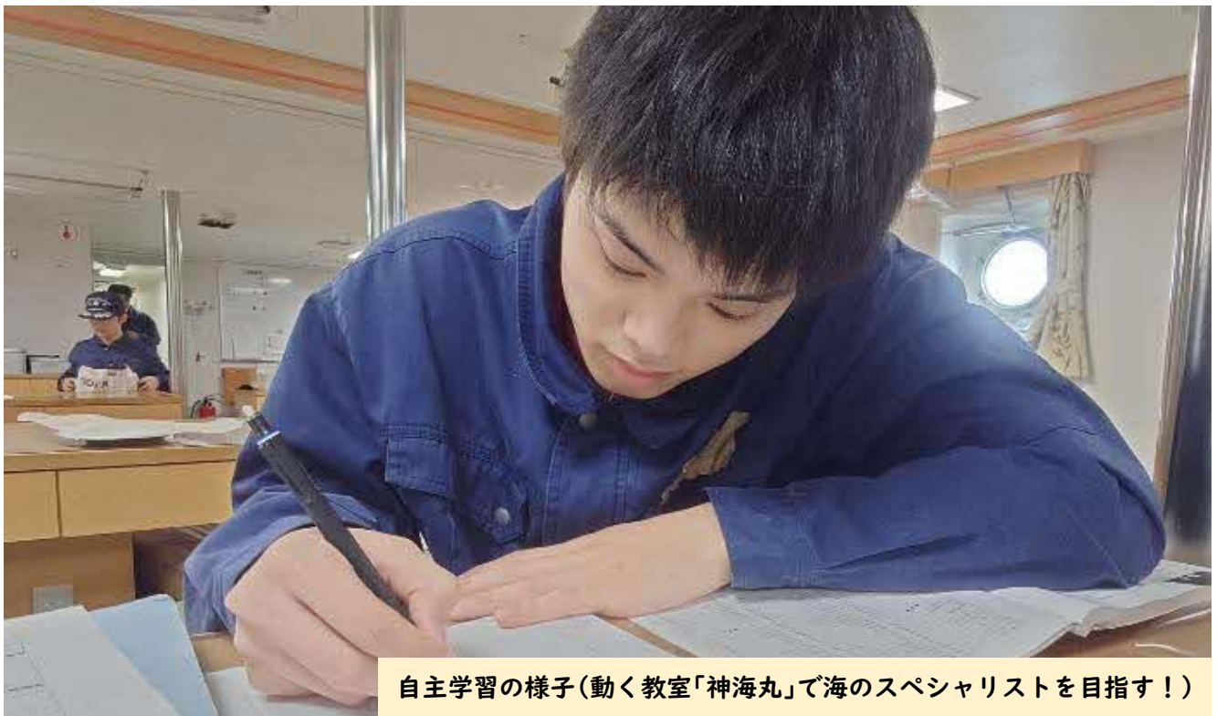
自主学习の様子(動く教室「神海丸」で海のスペシャリストを目指す!)

どうも、乗船主教官です。船に乗っていると、曜日感覚が無くなります。気づけば乗船してから2回目の日曜日でした。実習生たちは、学習に作業に忙しいけど充実した毎日を送っています。