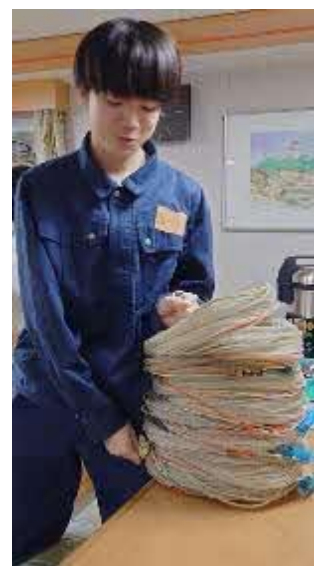
食当や、プランくくりの練習、天気の良い日はコンパステッキに出て、気分転換など船での生活を満喫しています！「今」しか出来ないことを積み重ねてほしいですね！