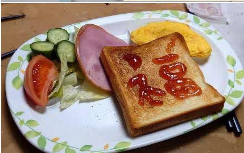
乗船教官 福田の「福」かも? ←

船内の航海中のルーティーンにも実習生たちは徐々に慣れてきました。専攻科生の先輩や乗組員さんと談笑をする姿も多く見ることが増えてきました。様々な人との関わりの中で、職業観や人生観の指針をこの実習期間で見つめ直してほしいですね!