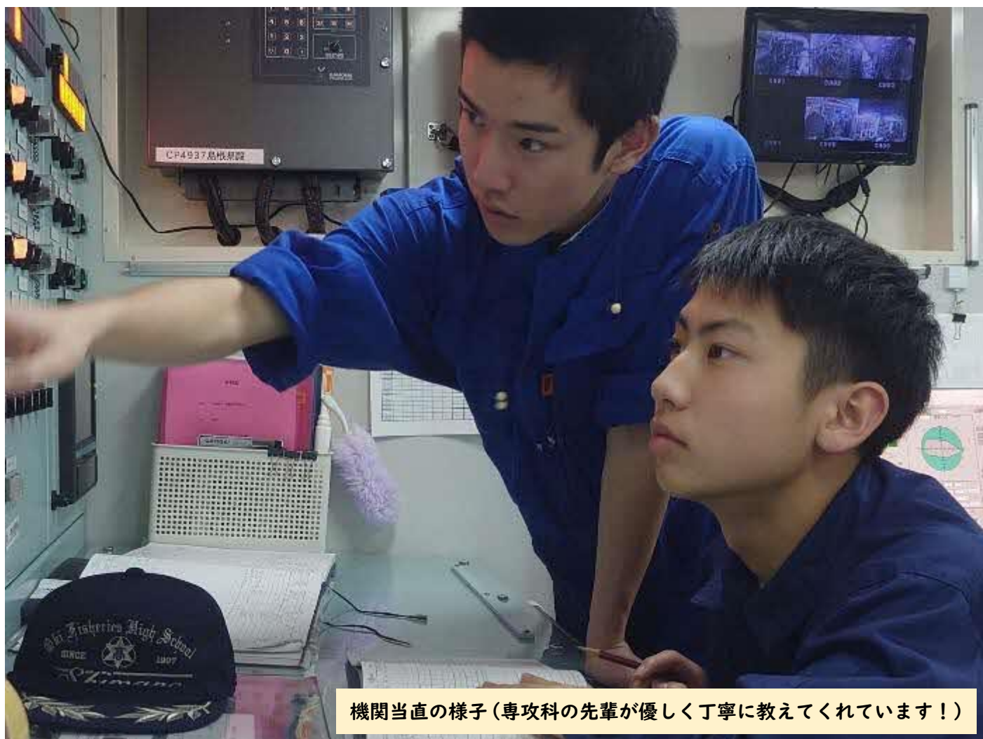
機関当直の様子(専攻科の先輩が優しく丁寧に教えてくれています!)

どうも、乗船主教官です。本日は天気が少し崩れてきていたので、実習生は船内で取り組めることを取り組みました！少しずつ船内に慣れてきつつあります。もうじき操業も始まります！