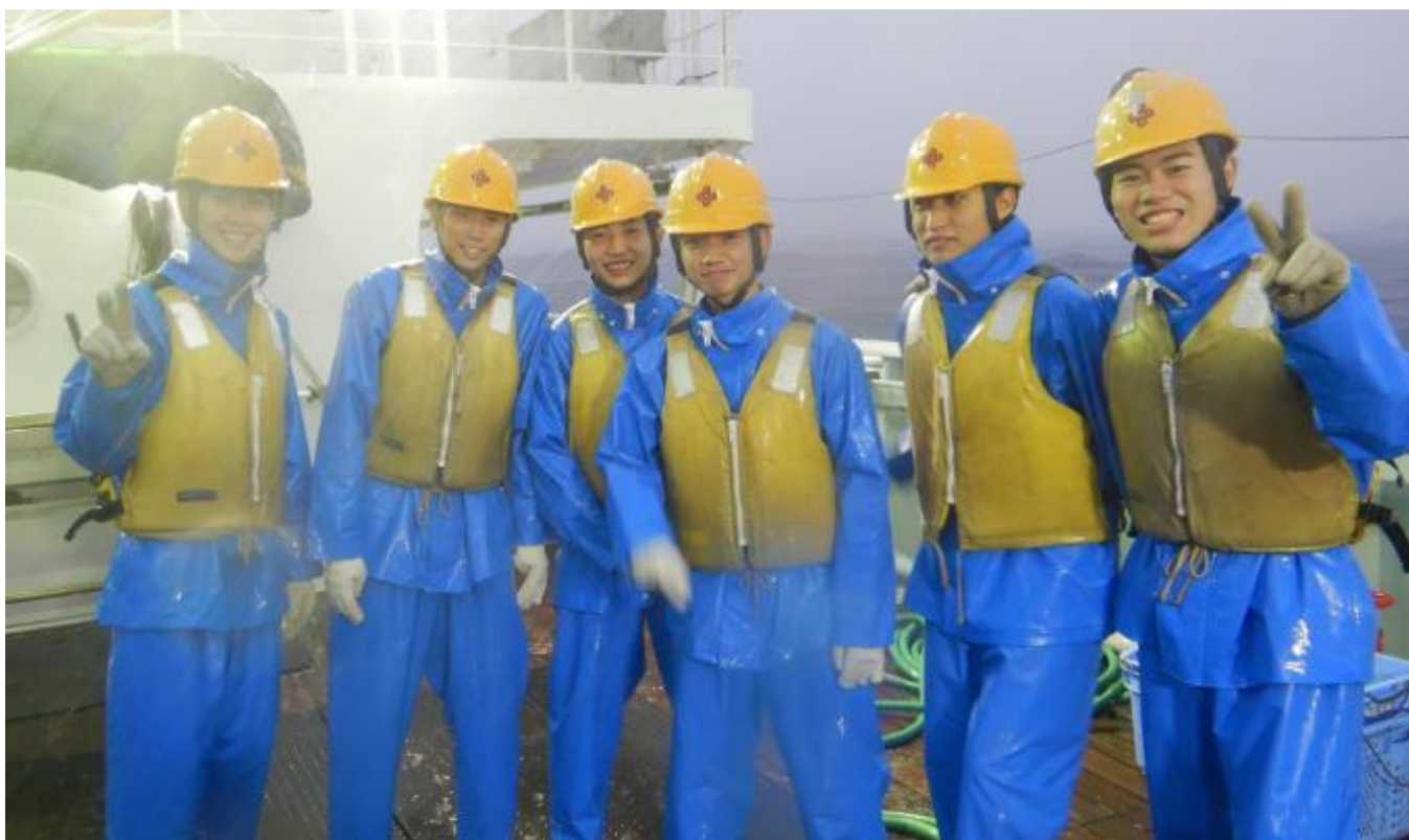
船内生活に慣れてきたのか、西郷港出港時に比べ表情が明るくなったように思います！