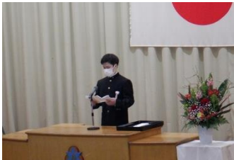
3年間の思い出を感謝の言葉に込めての答辞。担任も目頭を熱くしました。