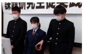
海洋テクノコース② 「島前への航海」