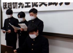
海洋テクノコース① 「隠岐の島の漁業を学ぶ」