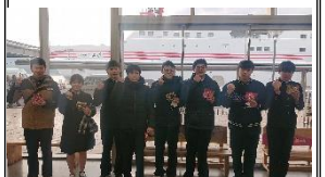
3級海技士受験出発