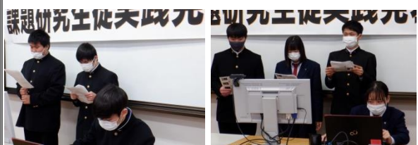
エンジニアコース 「ゴミステーションの作成・有木小学校の環境整備」 食品生産コース 「パイ貝知名度アップ大作戦」