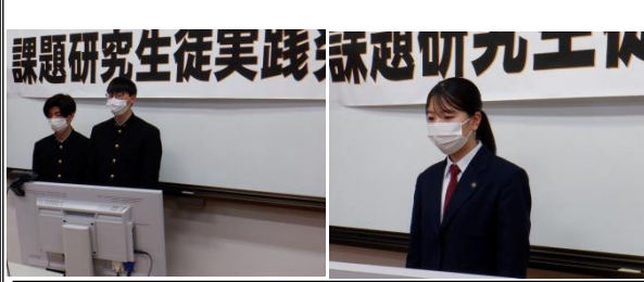
2Kの2名が司会 生徒会長の代わりに挨拶

生徒実践課題研究・実習体験発表会が1月28日に、学校関係者のみでオンライン方式によって行われました。3年生は最後の学校行事となりますので、緊張しながらも一生懸命に発表しました。そのときの様子です。エンジニアコースは東郷地区のゴミステーション製作・設置や有木小学校の遊具の修理、食品生産コースはパイ貝のアヒージョ缶詰新製品開発について、海洋テクノコースは隠岐のかなぎ漁について調べ、他班は島前まで自分たちで航海したこと、資源生産コースは、LED照明でワカメの種苗生産を行うことを発表しました。2年海洋システム科はマグロ実習で協力したことを発表しました。