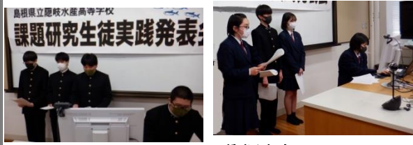
2年海洋システム科 「神海丸マグロ漁業実習」 資源生産コース 「隠岐の特産品を守れ Ver2」