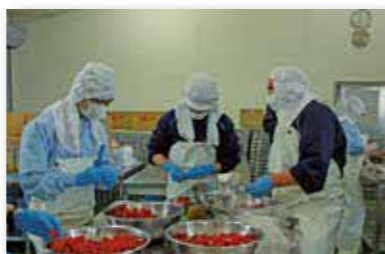
イチゴジャム製造実習

水産物の利用、加工及び食品全般にわたる基礎技術を学び、食品製造や経営に従事する技術者を養成します。