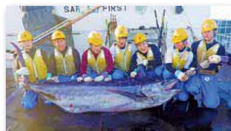
マグロ漁業実習 (ハワイ沖)

船長・機関長をめざす生徒が海洋システム科を卒業後、進学する科です。修業期間は2年で、修了時に3級海技士国家試験を受験し、免許取得後、官庁船や大型船の船舶士官として就職します。さらに1級・2級海技士筆記試験においては全国トップクラスの合格者数を誇ります。1年次、大型練習船「神海丸」に乗船し、太平洋でマグロ漁業実習を行い、帰航時には、ハワイに入港して国際感覚を養います。(新型コロナ感染状況で変更有り)